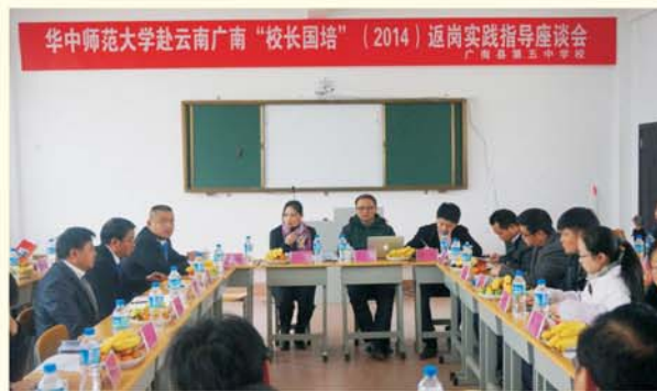
▲ 专家团队在云南广南五中与教师座谈