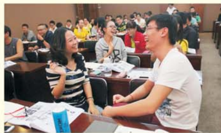
▲ 湖北省小学体育教师培训课堂