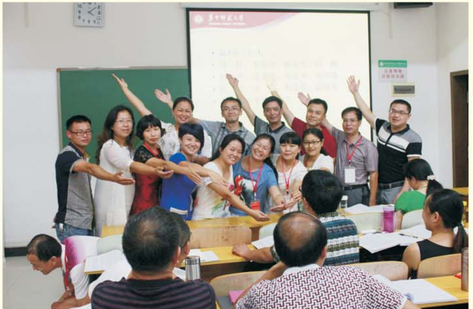
▲ 湖南省高中校本研训骨干教师培训课堂