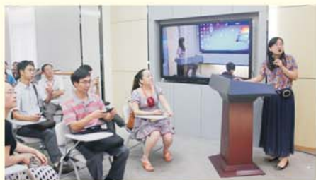
▲ 学员观摩国家数字化信息技术工程中心