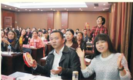
▲ 湖北省小学音乐教师培训课堂