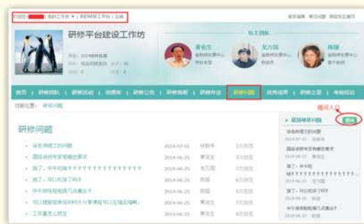
▲湖南省教师研修网