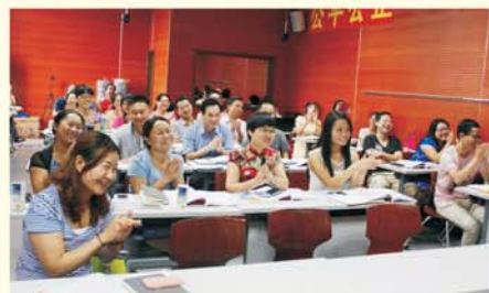
▲ 湖南省初中精英教师项目培训课堂