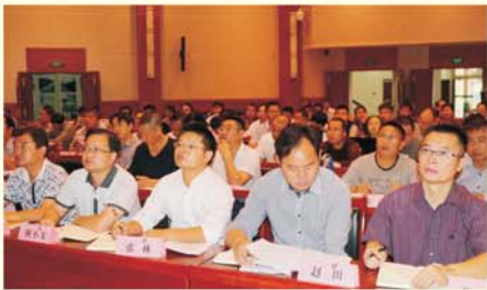
▲ “校长国培计划” 培训课堂

我校科学设计培训课程，在工作中不断优化培训内容，采取了多样化的培训模式，加速教师在课程改革背景下的角色转变，更加适应教育发展的需要。