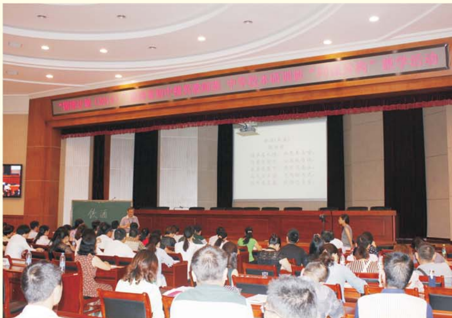
▲ 举办“同课异构”教学活动