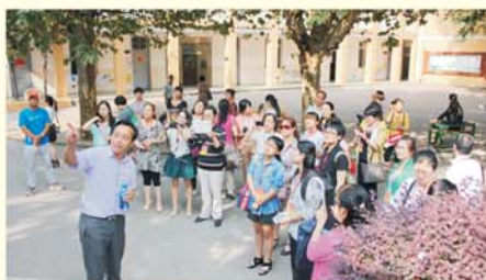
▲ 学员观摩武昌实验小学校园文化