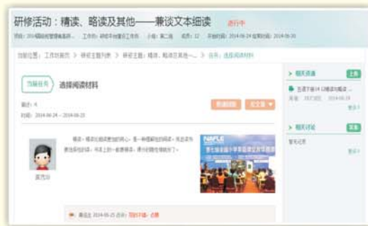
▲语文教师研修网络平台——线上学习