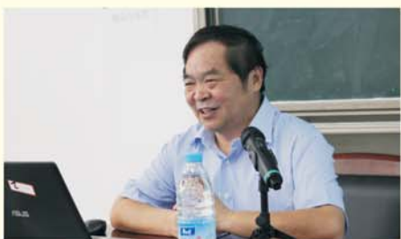
▲ 人民教育出版社 编审 顾之川

我校专家团队建设实行首席专家负责制，既有潜心研究基础教育和教师教育的大学教授，又有来自省内外一线教学名师与学员的互动交流与教学经验分享。教研名师们与学员分享了鲜活的教学案例、宝贵的研究经验，激励着学员主动汲取专业学识，加强教育科学理论研究，提高自身修炼。