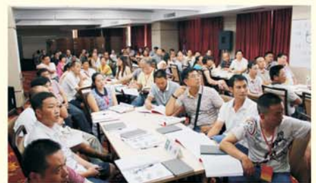
▲ 宁夏中小学校长信息技术能力提升培训课堂