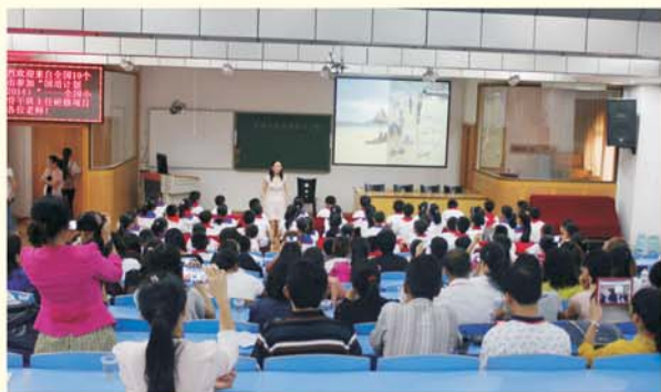
▲ 学员观摩华师附小音乐课

没有实践观摩的培训收不到实效。除了专题讲授之外，还特意为学员安排了名校参观考察、课堂观摩、示范课后互动研讨，为学员今后的教学实践提供了坚实的理论基础与丰富的实践经验。许多学员兴奋不已、激动不已，他们发现原来课可以这样上，学习也可以这样有趣。