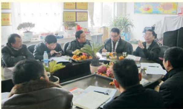
▲ 专家团队为白水镇中学诊断学校发展规划