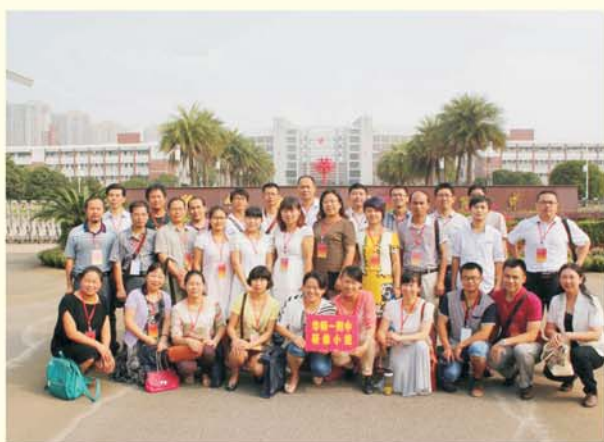
▲ 学员赴华师一附中进行影子跟岗研修

培训期间，学员们观摩了武汉市近20所中小学，学习了学校在教学管理、课程设置、教师队伍建设、教学质量的保障机制、学校资源的有效利用、家校共建等方面的先进经验，感受了学校的管理制度和 work 程序，并且每天坚持撰写跟班记录和心得体会，做到了学用结合，将培训中所学知识迅速在跟岗实践中体验。