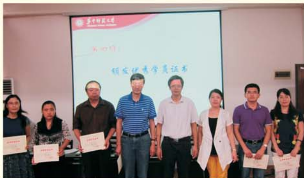
▲ 表彰全国地理培训团队研修项目优秀学员