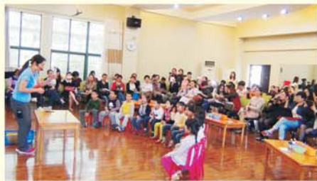
▲ 学员观摩省直机关第二幼儿园教学