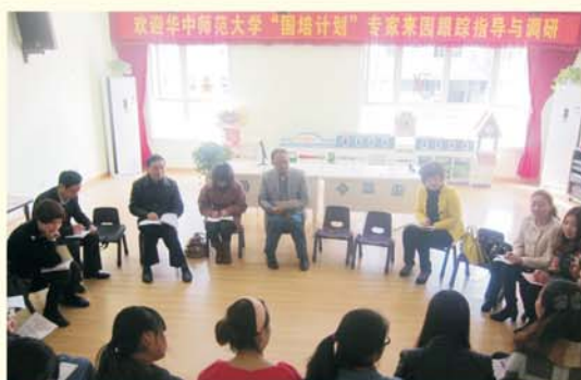
▲ 赴湖南省开展调研

2014年3月至4月，教师教育学院派出调研小组奔赴贵州、四川、甘肃、湖南、湖北等省开展跟踪指导与需求调研活动。通过问卷调查、座谈、访谈等形式调研一线中小幼教师培训需求，共回收调查问卷815份，为研制培训方案提供了有力的科学依据。