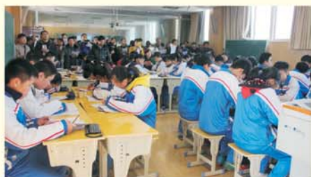
▲ 学员观摩洪山初中化学课