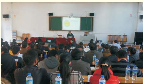
▲ 专家团队为广南县教师做专题报告

返岗实践指导期间，专家团队走进校园，进行实地勘察、现场指导，帮助制定学校中长期发展规划，实施学校改进行动计划。同时，专家团队还为边远贫困地区所在县市的教师做了“课堂教学改革、数字教师成长、教师心理调适、教育科研写作”等主题的专题讲座，助力基础教育均衡发展。