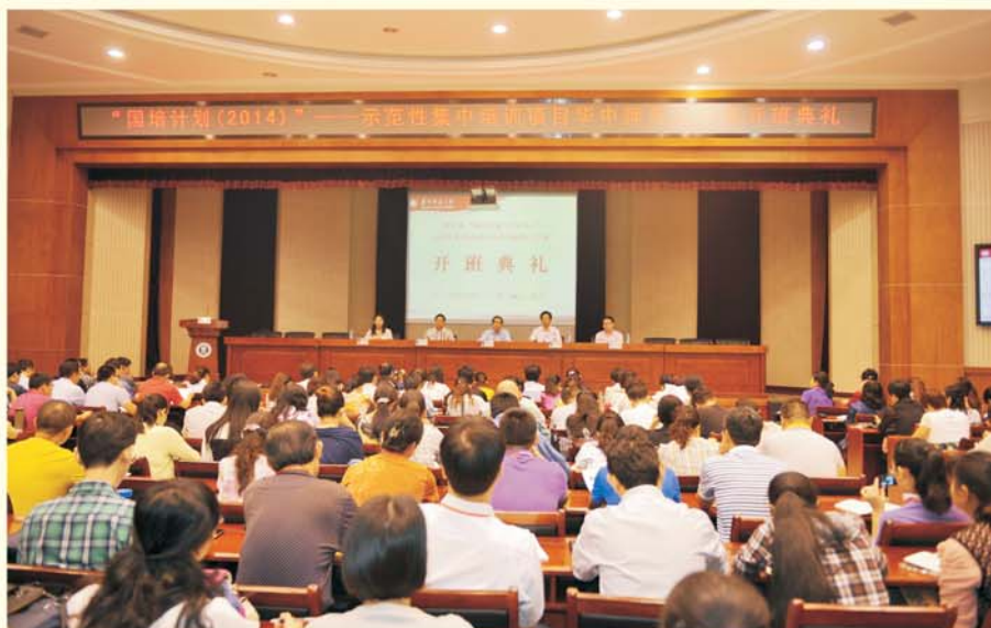
▲庄严而又隆重的开班典礼