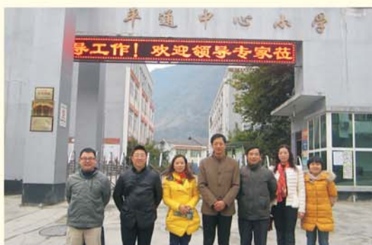
▲ 赴四川省开展调研