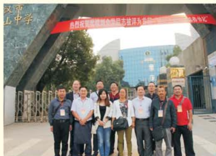
▲ 学员赴马房山中学进行影子跟岗研修