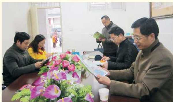
▲ 专家团队在四川平通中心小学审阅校本教材