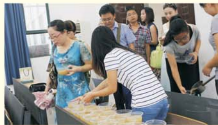
▲为学员准备的降暑“绿豆汤”