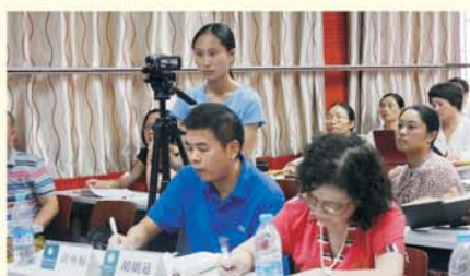
▲班主任全程录制课程资源