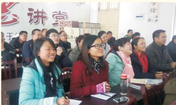
▲ 认真听专家报告的地方教师