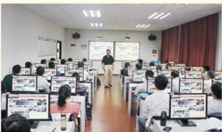
▲ 全国小学骨干班主任教师培训课堂