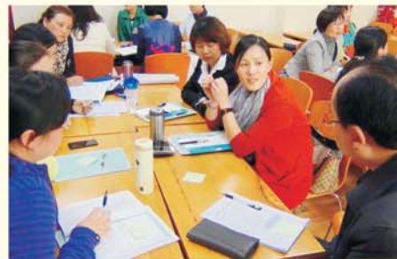
▲ 导师指导小组学习