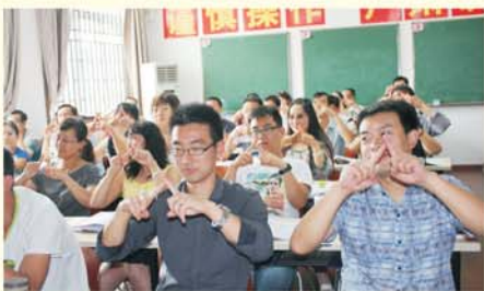
▲ 甘肃省初中骨干班主任教师培训课堂