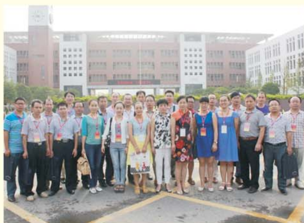
▲ 学员赴华中科技大学附中进行影子跟岗研修