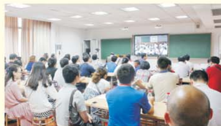
▲ 学员观摩华师一附中信息化教学