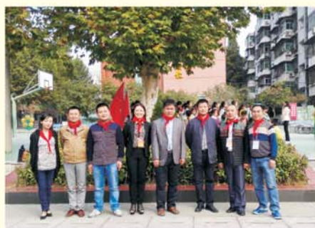
▲ 学员赴南望山小学进行影子跟岗研修