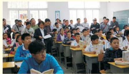
▲ 学员观摩卓刀泉中学课堂