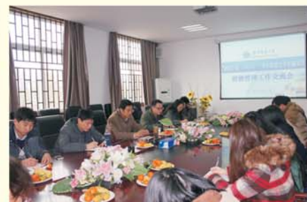
▲ 召开国培班主任工作会议