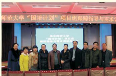
▲ 赴甘肃省开展调研