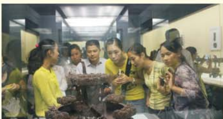
▲学员欣赏荆楚文物