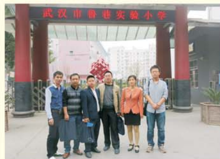
▲ 学员赴鲁巷实验小学进行影子跟岗研修