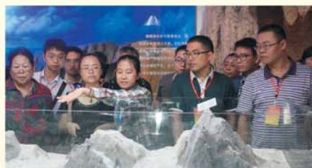
▲学员参观中国地质大学博物馆