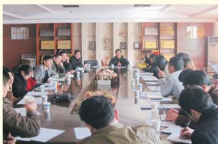
▲ 赴湖北省开展调研