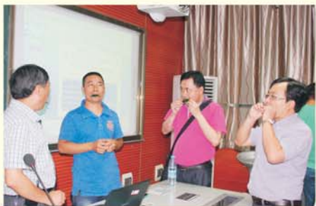
▲ 开展学员课间实践