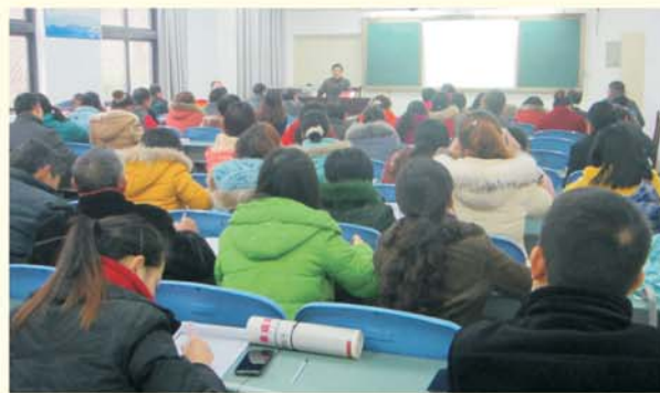
▲ 专家团队为平武县教师做专题报告