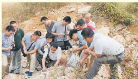
▲ 学员和导师在野外考察地质构造