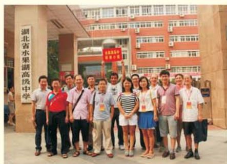
▲ 学员赴水果湖高中进行影子跟岗研修