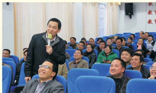
▲ 专家团队为那坡县教师做专题报告