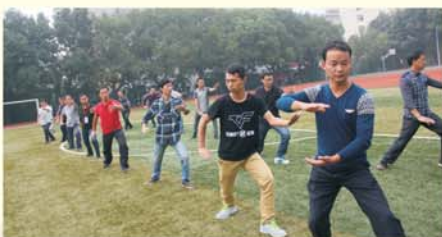
▲学员课间打太极拳