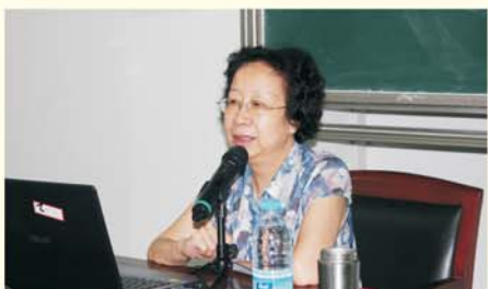
▲ 湖北省教育督学 研究员 靳岳滨