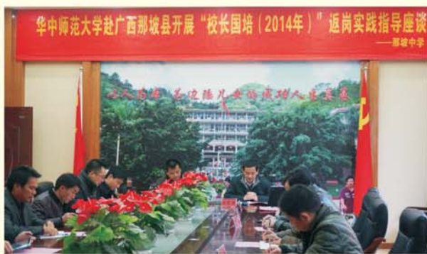
▲ 专家团队赴广西省开展返岗实践指导