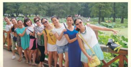
▲学员情结东湖观赏荷花