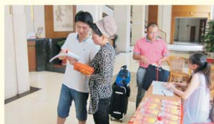
▲班主任悉心解答学员问题