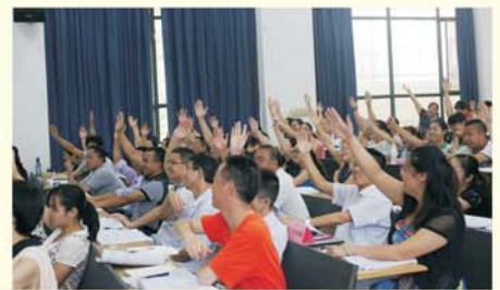
▲ 贵州省高中数学骨干教师培训课堂