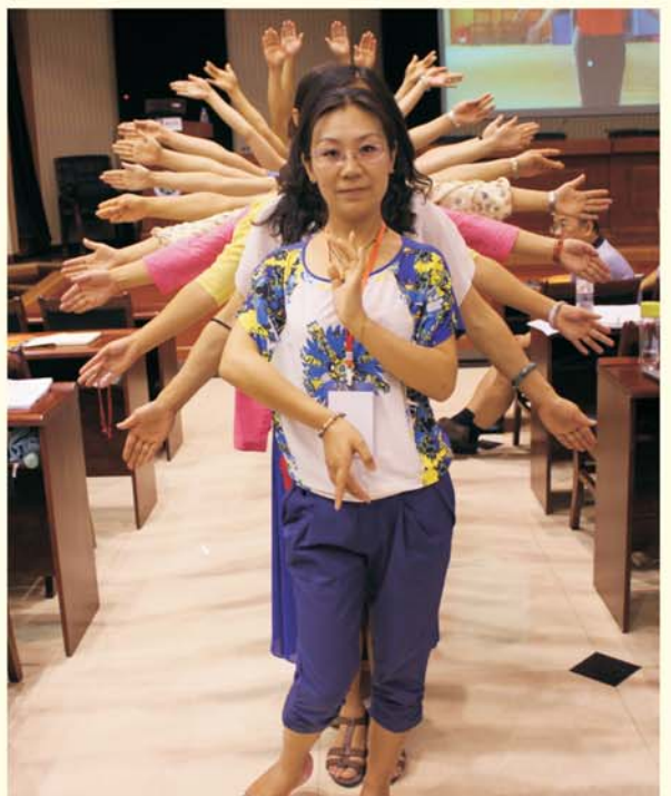
▲学员课间表演《千手观音》