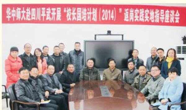
▲ 专家团队赴四川省开展返岗实践指导

为切实提高边远贫困地区农村学校校长队伍的整体素质和办学治校能力，我校于2014年12月，组织专家赴四川、贵州、云南、广西等相关县市对“校长国培计划（2014）”项目华中师范大学班学员进行返岗阶段的面授指导，帮助农村学校校长掌握诊断学校发展问题、制定学校发展规划的基本方法。