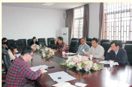
▲ 召开国培项目承办单位协调会

加强国培计划管理工作，积极推进管理工作制度化、规范化。培训前，教师教育学院专门组织对班主任、副班主任进行了工作部署和岗前培训，并组织召开教育学院、生科院等承办单位工作协调会，保障国培项目实施有计划、有重点、有条理。