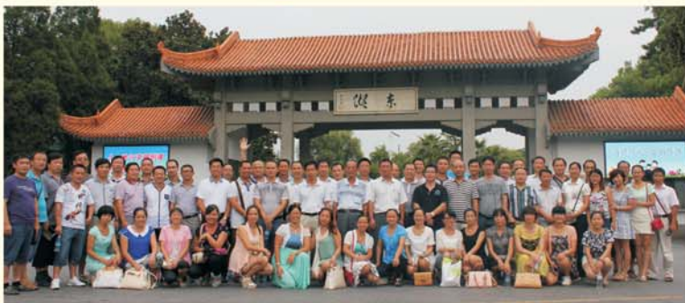
▲学员览胜荆楚文化