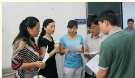
▲班主任组织召开班委会