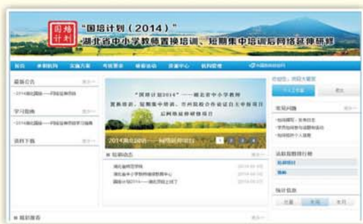
▲湖北省教师研修网

我校依托中国教师研修网、湖南省中小学教师发展网、甘肃省教师研修网等网络平台，建立教师工作坊，专家在工作坊中组织学员进行网上学习研讨，解疑答惑。