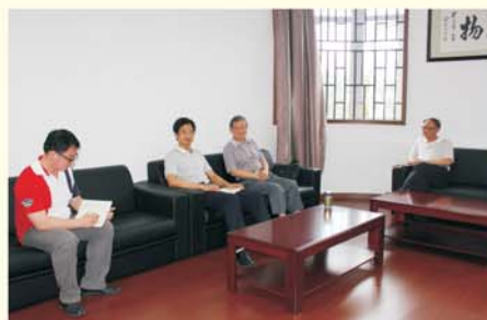
▲ 咨询专家研制方案