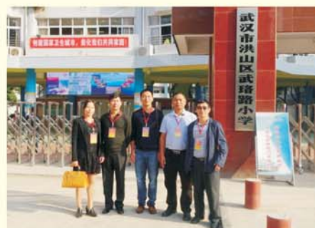
▲ 学员赴武珞路小学进行影子跟岗研修