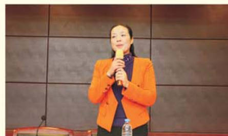
▲ 全国师德标兵、特级教师 杨小玲