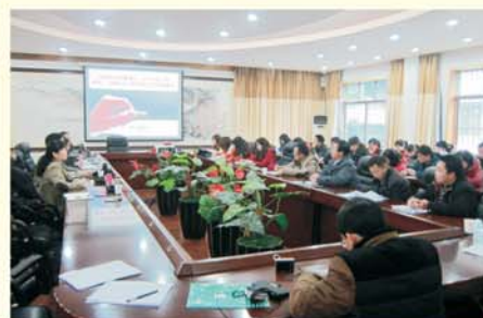
▲ 赴贵州省开展调研

加强国培计划管理工作，积极推进管理工作制度化、规范化。培训前，教师教育学院专门组织对班主任、副班主任进行了工作部署和岗前培训，并组织召开教育学院、生科院等承办单位工作协调会，保障国培项目实施有计划、有重点、有条理。