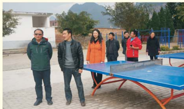
▲ 专家团队在云南广南坝美阿科初级中学现场指导