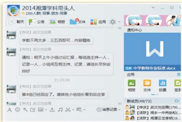
▲通过国培QQ群组织交流学习

充分发挥网络研修社区对学员的后续指导和互助学习的平台作用，提供丰富的学习资源，进而为学员线下开展校本研修活动提供指导，这种混合式培训模式将集中面授培训和网络研修的优势进行了整合，能提升培训效果。