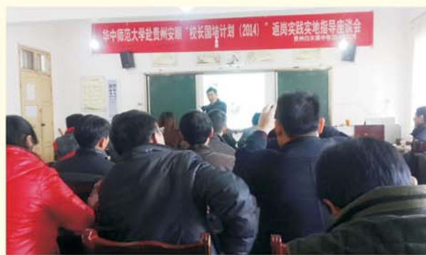
▲ 专家团队赴贵州省开展返岗实践指导