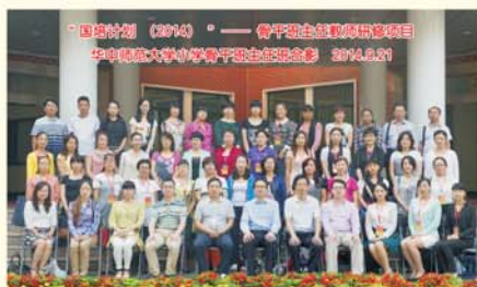
▲富有纪念意义的学员合影

在班级管理中坚持以学员为本，及时解决学员实际困难和合理诉求。每班配备两名专职班主任，全天候负责培训班的日常事务和学员管理服务。班主任和学员学习在一起、吃住在一起，全身心投入到组织实施工作中，保证各项工作有序高效地进行。课上，协助学员互动，全程拍照摄像；课间，耐心解答学员疑问，尽可能满足合理要求，使广大参训教师在培训期间学习安心、生活舒心、事事顺心。