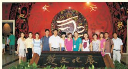
▲学员参观楚文化展