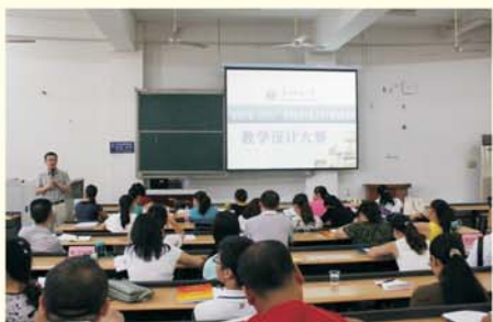
▲ 举办教学设计大赛

学员参与培训的积极性是培训效果的保障。我校精心为学员组织策划了“教学大练兵、圆桌论坛、小组学习、说课比赛、微课比赛”等活动，为学员搭建交流平台，推动全体学员间相互研讨心得，在交流中分享经验，在合作中提高能力，在碰撞中增长智慧，提升了培训实效。