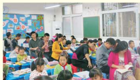
▲ 学员观摩武珞路小学语文课