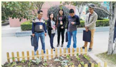
▲ 学员观摩南望山小学实践课