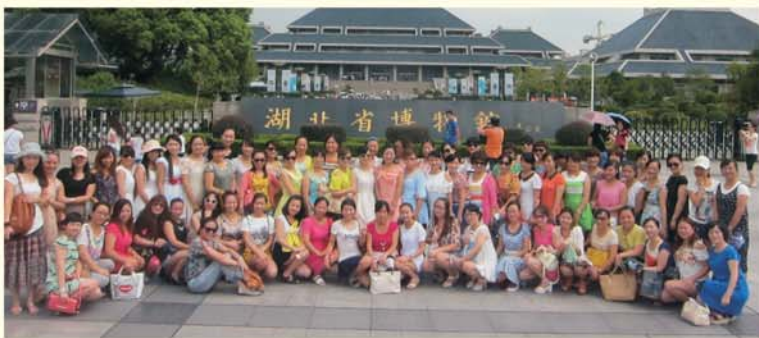
▲学员参观湖北省博物馆

学员心情愉悦、课外活动丰富，是我校培训工作的特色。我校实施了班主任团队、班委会团队及小组团队相结合的“团队化”管理方式。在班主任的指导下，每期项目都组织学员在课余时间参观省博物馆、东湖、地质大学博物馆等，领略荆楚文化。班委会和学习小组举办联欢晚会，交流情谊、加深情感，努力创建活跃、和谐、温暖、有凝聚力的班集体。