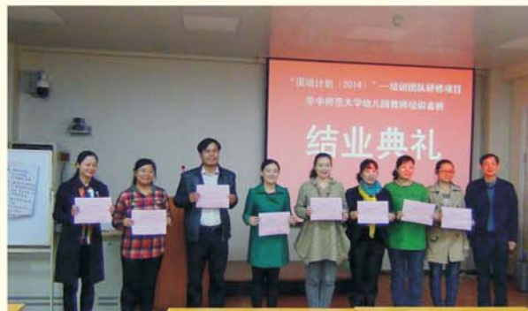
▲ 表彰全国幼儿园培训团队研修项目优秀学员