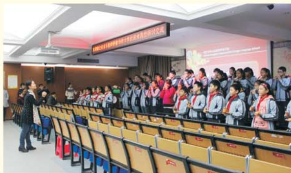
▲ 学员观摩洪山实验外校合唱团