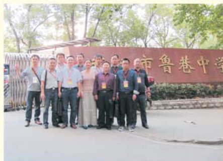
▲ 学员赴鲁巷中学进行影子跟岗研修