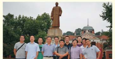
▲学员参观辛亥革命纪念馆