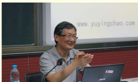
▲ 语文名家、特级教师 余映潮

特级教师为学员们带来了工作技巧和方法方面的内容，这些多是由一线教师以切身体会而产生的工作感悟。他们渊博的专业学识、宽广的教育视野、倾心教育的那份执着，尤其是丰富的教学案例生动且贴近教育教学实践，可操作性强、实用有效，能科学有效指导学员们的教学工作，颇受欢迎。