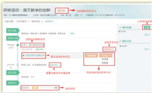
▲语文教师研修网络平台——主题讨论