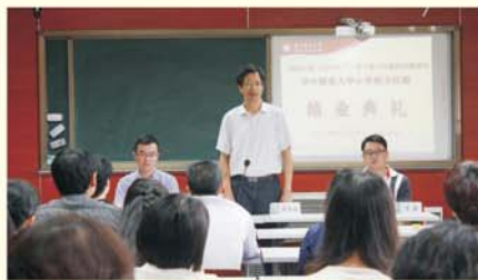
▲留下记忆的结业典礼