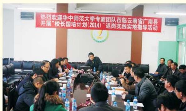
▲ 专家团队赴云南省开展返岗实践指导