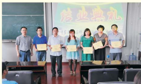
▲ 表彰全国生物培训团队研修项目优秀学员