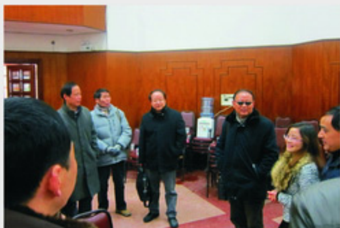
省教育厅领导送来亲切关怀