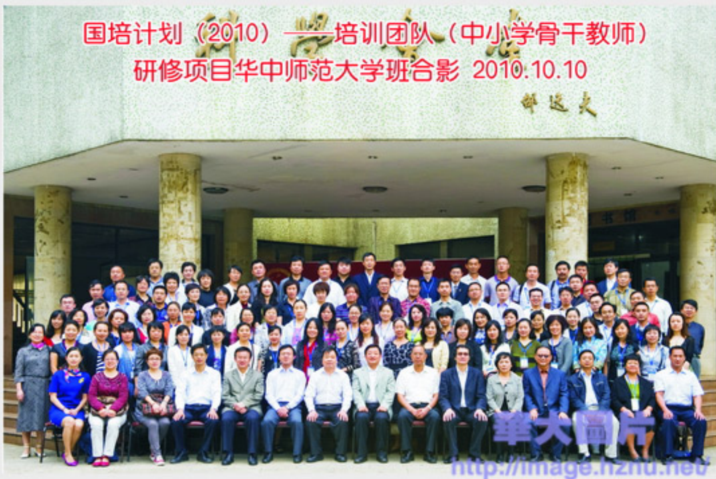
国培计划（2010）——培训团队（中小学骨干教师） 研修项目华中师范大学班合影 2010.10.10