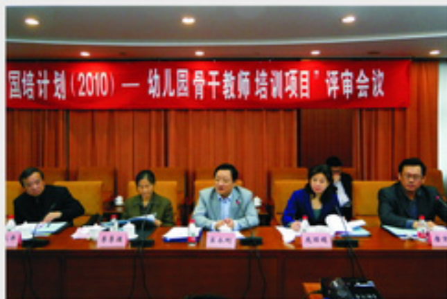
教育部国培计划项目评审专家