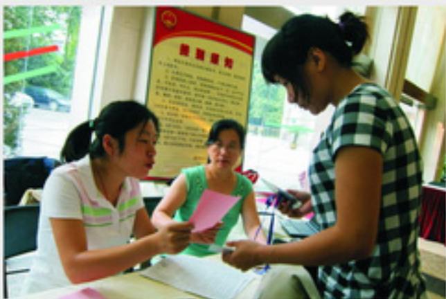
认真解答学员疑问