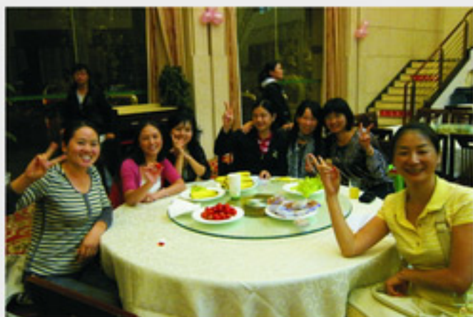
国培中秋的月饼美果