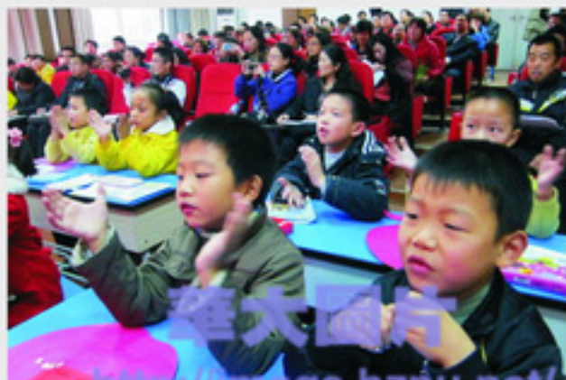
进课堂观摩示范课