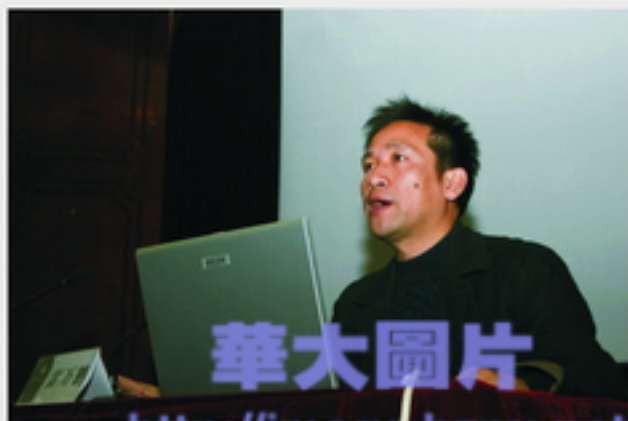
华中师范大学教授雷万鹏