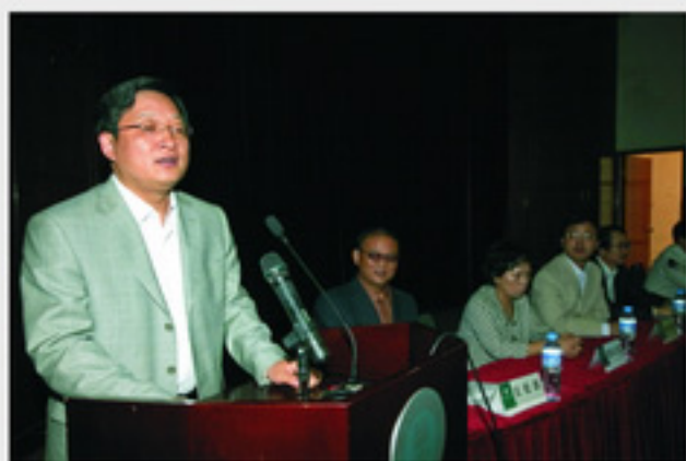
教育部师范司宋永刚副部长出席开班典礼并讲话