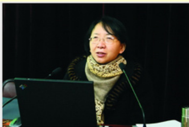
北京师范大学冯晓霞教授