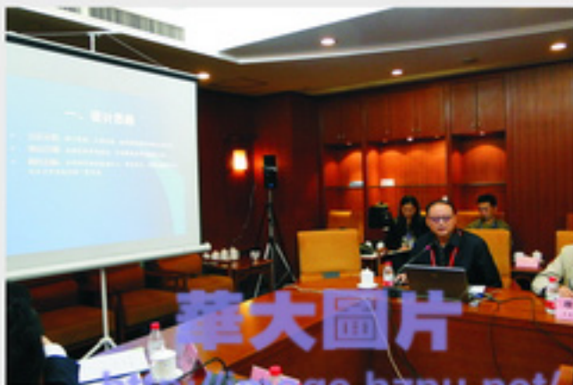
我校参加教育部国培计划项目评审会