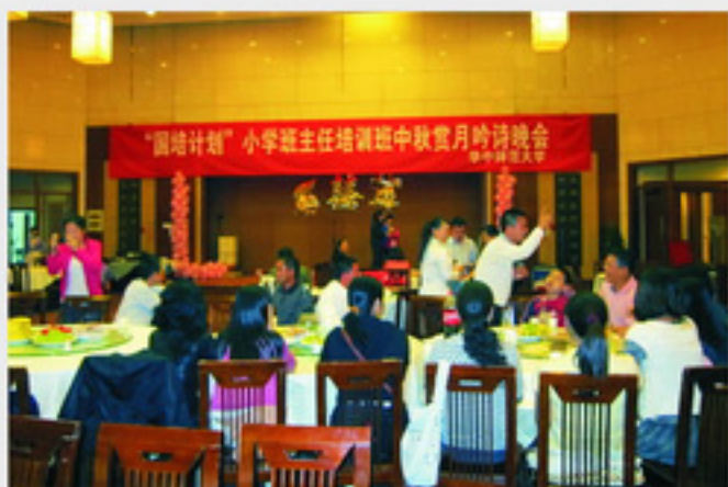
国培中秋吟诗赏月

此次培训抽调了一批具有较强教师培训工作经验的专业人员负责培训管理与服务，每班配备两名专职班主任和两名助理，有36人次直接参与培训班管理。在学员中成立班委会和推选小组长，制定了严格细致的组织管理办法和 workflows，各项工作领导到位、责任到位、服务到位，分工协作，从小事做起，从点滴做起，狠抓落实，班主任和学员学习在一起、吃住在一起，全身心投入到组织实施工作中，保证各项工作有序高效地进行，使广大参训教师在培训期间学习安心、生活舒心、事事顺心。